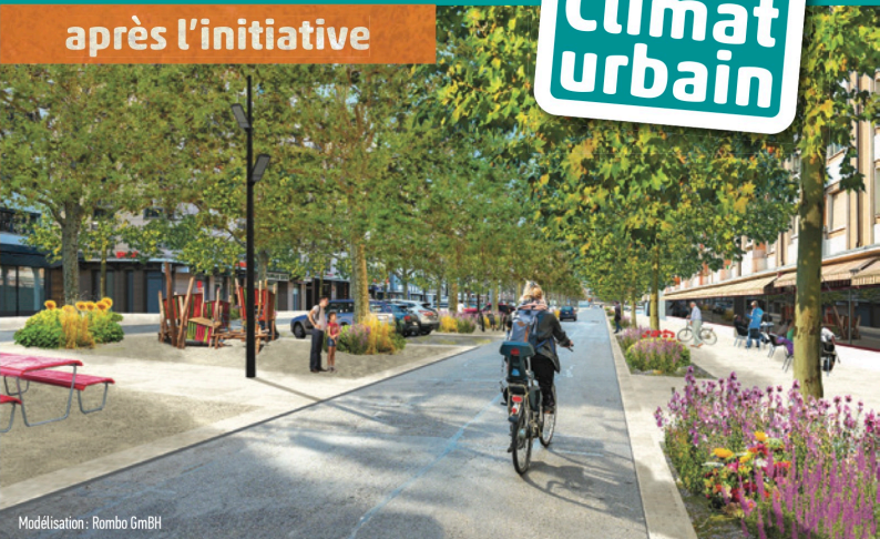
Modélisation : Rombo GmbH

À cause de l'effet « îlot de chaleur », Genève sera l'une des zones urbaines du monde où le changement climatique se fera particulièrement ressentir.